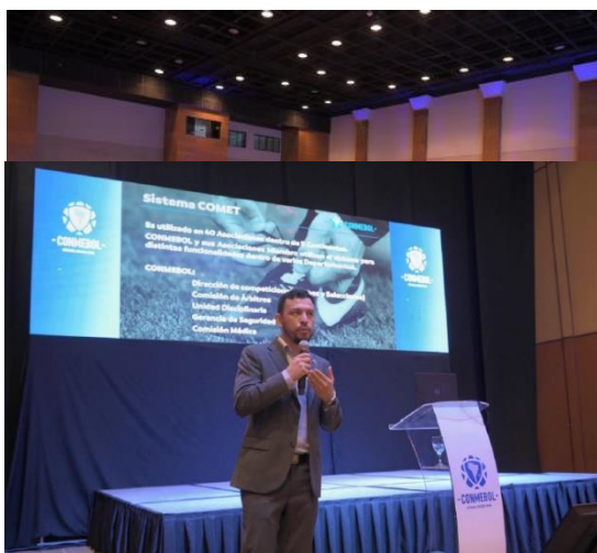
REFERENCIAS WORKSHOP DE OFICIALES DE PARTIDO 2021 – SALA 2